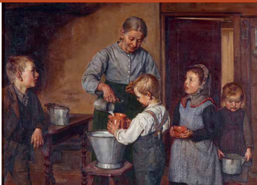
Friedrich Stirnimann (1841–1901); «Milchhausmessen», 1891; Öl auf Leinwand; Kunstmuseum Luzern; © Foto: Andri Stadler, Luzern

aber irgendwann ging's nicht mehr und der modrige Geruch kroch mir in Mund und Nase. So riecht es im Haus der Alten. Als ich meine Mutter mal fragte, wieso das ganze Dorf dort Milch kauft, sagte sie: «So war's schon immer.» Schon meine Mutter war bei der Alten Milch holen, hat sie erzählt, schon damals sei sie alt gewesen.